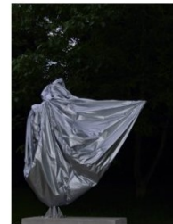
„Rock“ kinetische Skulptur, 2008, Spinaker Seide, Edelstahl, Aluminium, Motoren, Steuerung, 250 x 250 x 250 cm

Am Ende haben Thomas Baumanns Apparaturen, so subjektiv und objektiviert sie zunächst wirken mögen, mehr als vermutet mit jenen „sanften Maschinen“ zu tun, von denen William Burroughs einmal sagte: „Soft Machine, die Weiche Maschine, ist der menschliche Körper unter konstanter Belagerung durch eine riesige hungrige Masse von Parasiten, die viele Namen haben, aber nur einen Zug zeigen, hungrig zu sein, nur ein Ziel verfolgen, zu fressen.“ 1 Selbstverständlich inszeniert Baumann kein derartiges Bedrohungsbild, wonach einem schützenswerten Subjekt eine feindliche und kalte Umgebung gegenübersteht. Vielmehr nimmt er die maschinelle Dimension des Objektiven und Objekthaften selbst zum Ausgangspunkt, um daraus ein Quantum an Rest-Subjektivität zu destillieren. Gerade in den Überschüssen und Brüchen, die anhand regelgesteuerter Abläufe ersichtlich werden, zeichnet sich ein schwer einordenbarer subjektiver Mehrwert ab. Ein Surplus, das sich den gefräßigen Parasiten der Gegenwart behände widersetzt.