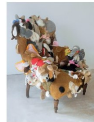
„Ohrensessel“, 2011, ca. 90 x 130 cm

Mit dem Bleistift zeichne ich nicht im herkömmlichen Sinn, vielmehr ist er für mich ein Werkzeug, um Papier zu gravieren und zu dehnen. Durch manuell erzeugten Druck wird Stück für Stück Schrift und Farbe der „collageartig“ zusammen gesetzten Unterlagen abgerieben. Ich bezeichne diese Technik Prêtage – als eine Weiterentwicklung der Frottage. Prêtage impliziert die Verwendung von Vorhandenem, schnell Greifbarem wie beispielsweise die Werbezeitschrift oder ein altes Buch, Bleistift und Papier. Andererseits meint die Bezeichnung auch die Dehnung eines Materials. Rückseite wird Vorderseite, die Zeichnung ist Spiegel verkehrt- genau wie jene Textfragmente oder Buchstabenbruchstücke, die von der Unterlage abgedruckt und in das Papier eingepreßt werden.