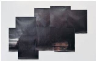
„Auflösung“, 2010, 8 Farbabzüge je 145 x 126 cm, 3,26 x 4,85 m, Ausstellungsansicht Camera Austria, Jänner 2011, Foto: Steffen Strassnig

Auflösung (2010) setzt sich aus acht Farbabzügen zu je 145 mal 126 Zentimetern zusammen, die jeweils einen stark vergrößerten Ausschnitt einer existierenden Fotografie wiedergeben, die Lecomte in Abschnitten abfotografiert hat. Die Vorlage wurde dabei nicht vollständig und in exakt aufgeteilten Segmenten erfasst, sondern gleichsam mit dem „freien Auge“, was in Hinblick auf das Gesamtbild sowohl zu