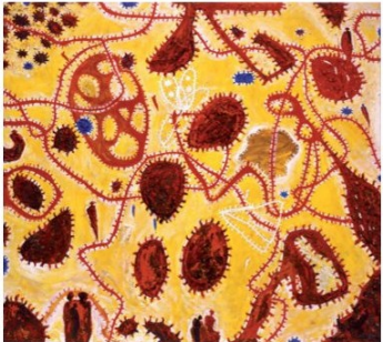
„Gelbfeldweltwegorte“, 2006/07, Öl/Leinwand, 180 x 200 cm

Die Entstehung meiner Arbeiten verdankt sich einem Ablauf von Handlungen und Überlegungen, Wiederholungen, verworfenen Anfängen in Fortsetzung, dahinfließenden Bewegungen aus Ähnlichkeiten und Weitergesponnenem.