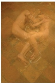
„Werkzyklus Archeologia/88 Maps“ 2006, 144 C-Prints, je 20 x 30 cm

Wolfgang Sohm zum Werkzyklus Archeologia/88 Maps, 2008