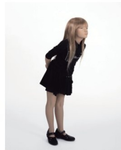
„All for your Delight III“, 2011, Pigment - Print auf Aluminium, Kassettengerahmen, Acrylglas, 148 x 120 cm

„Auf den ersten und flüchtigen Blick realisiert sich in Robert F. Hammerstiels sonniem Weltentwurf das Glück der Menschen. In den schmucken Häusern des Lotto-Paradieses, auf dem pflegeleichten Kunstrasen nachbarschaftsfreundlicher Vorgärten mit und ohne Aufblaspool, in den bezaubernden Wohn- und den traumhaften Schlafzimmern, in den ihnen vorgelagerten keimfreien Musterküchen und in den sauberen und in angemessenem Minimundus-Maßstab möblierten Kinderstuben regieren Friede und Idylle, nicht zuletzt gestützt auf jene Angebote aus Warenhäusern, Versandhauskatalogen und Shoppingmärkten, welche für die Erfüllung von dreams, that money can buy Sorge tragen.“